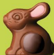
Praliné et riz soufflé